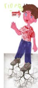
Εικόνα 2. Έργο μαθητή από τη δραστηριότητα «Οι ρίζες μου».

Οι γονείς σε συνεργασία με τα παιδιά συμπληρώνουν ένα σχεδιάγραμμα με την καταγωγή όλης της οικογένειάς τους και στη συνέχεια παρουσιάζουν το γενεαλογικό τους δένδρο και το σχεδιάγραμμα της καταγωγής στους υπόλοιπους. Εντυπωσιακή είναι η διαπίστωση ότι όλες οι οικογένειες στην τάξη μας έχουν προσφυγικές ή μεταναστευτικές ρίζες. Πρόσφατες, ως αλλοδαποί μετανάστες από την Αλβανία ή παλινοστούντες από τις χώρες της πρώην Σοβιετικής Ένωσης, ή παλιότερες ως πρόσφυγες από την Ανατολική Θράκη και τη Μ. Ασία ή ως οικονομικοί μετανάστες στην Γερμανία. Η διαπίστωση αυτή δίνει το έναυσμα για συζητήσεις ανάμεσα στους γονείς και ανταλλαγή εμπειριών και συναισθημάτων.