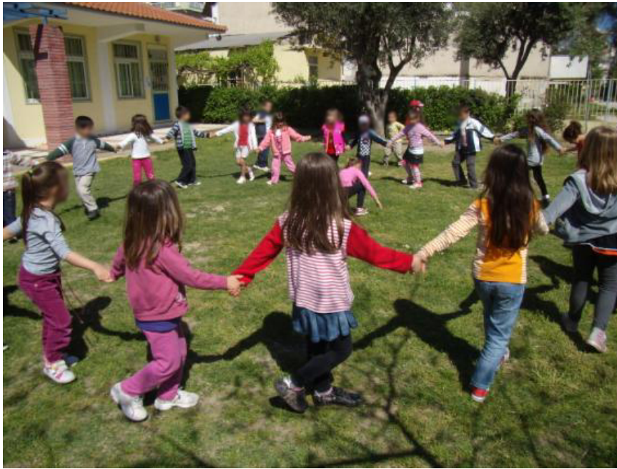
Εικόνα 8. Δραστηριότητα στο σχολείο με τους γονείς: Παιχνίδια των χωρών καταγωγής.