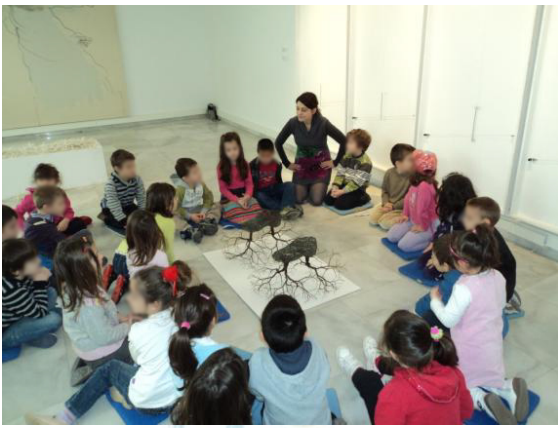
Εικόνα 1. Το 6 ο Νηπιαγωγείο Περαιάς στο Μακεδονικό Μουσείο Σύγχρονης Τέχνης.