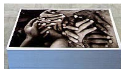
«Το παιχνίδι με τα χέρια», Michel Francois