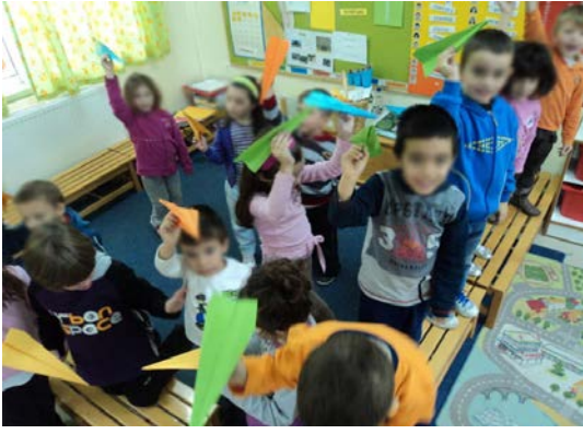
Εικόνα 3. Δραστηριότητα στο σχολείο: «Το αεροπλάνο».