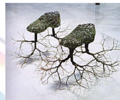
«Χωρίς Τίτλο», Γ. Γυπαράκης

Το έργο τέχνης «Το Παιχνίδι με τα χέρια», του M. Francois, 1989 , στο οποίο χέρια με διαφορετικά χρώματα ενώνονται ανασύροντας μνήμες ενός παραδοσιακού παιχνιδιού που μεταφέρεται από γενιά σε γενιά σε διάφορες χώρες, γίνεται μέσο για τη διερεύνηση μη λεκτικών τρόπων επικοινωνίας στο πλαίσιο του παιχνιδιού, μιας γλώσσας οικουμενικής στον κόσμο των παιδιών.