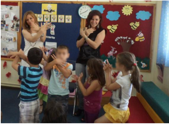
Εικόνα 7. Δραστηριότητα στο σχολείο με τους γονείς: Παιχνίδια των χωρών καταγωγής.