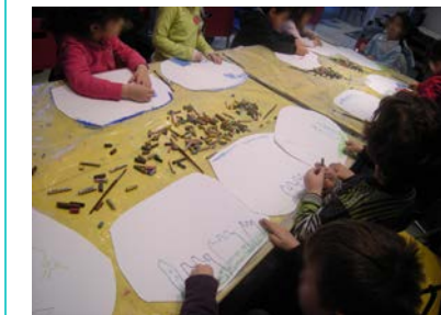
Εικόνα 6. Εικαστική έκφραση στο μουσείο.

Στην τελευταία φάση του προγράμματος, τα παιδιά στους χώρους των εργαστηρίων εκφράζονται καλλιτεχνικά και δημιουργούν τα δικά τους έργα. Πειραματίζονται με την τεχνική του κολλάζ και της ζωγραφικής δημιουργούν την ιστορία του δικούς τους «παπουτσιού», το οποίο ταξίδεψε αποτυπώνοντας βιώματα και σκέψεις για τη δική τους κατάσταση.