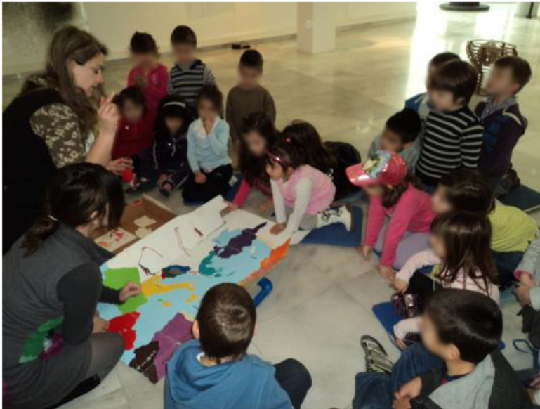
Εικόνα 5. Δραστηριότητα στο μουσείο με τη βαλίτσα-χάρτη.

Με οδηγό μια βαλίτσα-χάρτη και αναζητώντας μεταφορικό μέσο οδηγούνται στο «Αεροπλάνο» του Α. Ακριθάκη. Αναγνωρίζουν την τεχνική του assemblage μέσα από ένα εικαστικό παιχνίδι δόμησης και αποδόμησης. Στη συνέχεια, στο πλαίσιο ενός κινητικού παιχνιδιού συνθέτουν με τα σώματα τους ένα αεροπλάνο και γίνονται επιβάτες προερχόμενοι από διαφορετικούς τόπους προέλευσης με κοινό προορισμό την πόλη της Θεσσαλονίκης. Στο πλαίσιο ενός ομαδοσυνεργατικού παιχνιδιού προσομοιώνουν ένα ταξίδι διαγράφοντας τη διαδρομή του ταξιδιού τους, από τη μία χώρα στην άλλη, σε έναν χάρτη στον οποίο αποτυπώνονται χρωματικά οι χώρες.