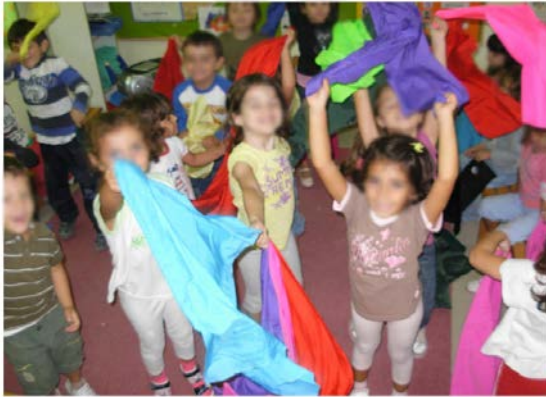
Εικόνα 4. Δραστηριότητα στο σχολείο: «Ανοίγω τα φτερά μου».

Παρατηρούν το έργο Εκρήξεις Συναισθημάτων του Dennis Oppenheim, προσπαθούν να εξηγήσουν τον τίτλο του έργου και δίνουν τη δική τους ερμηνεία.